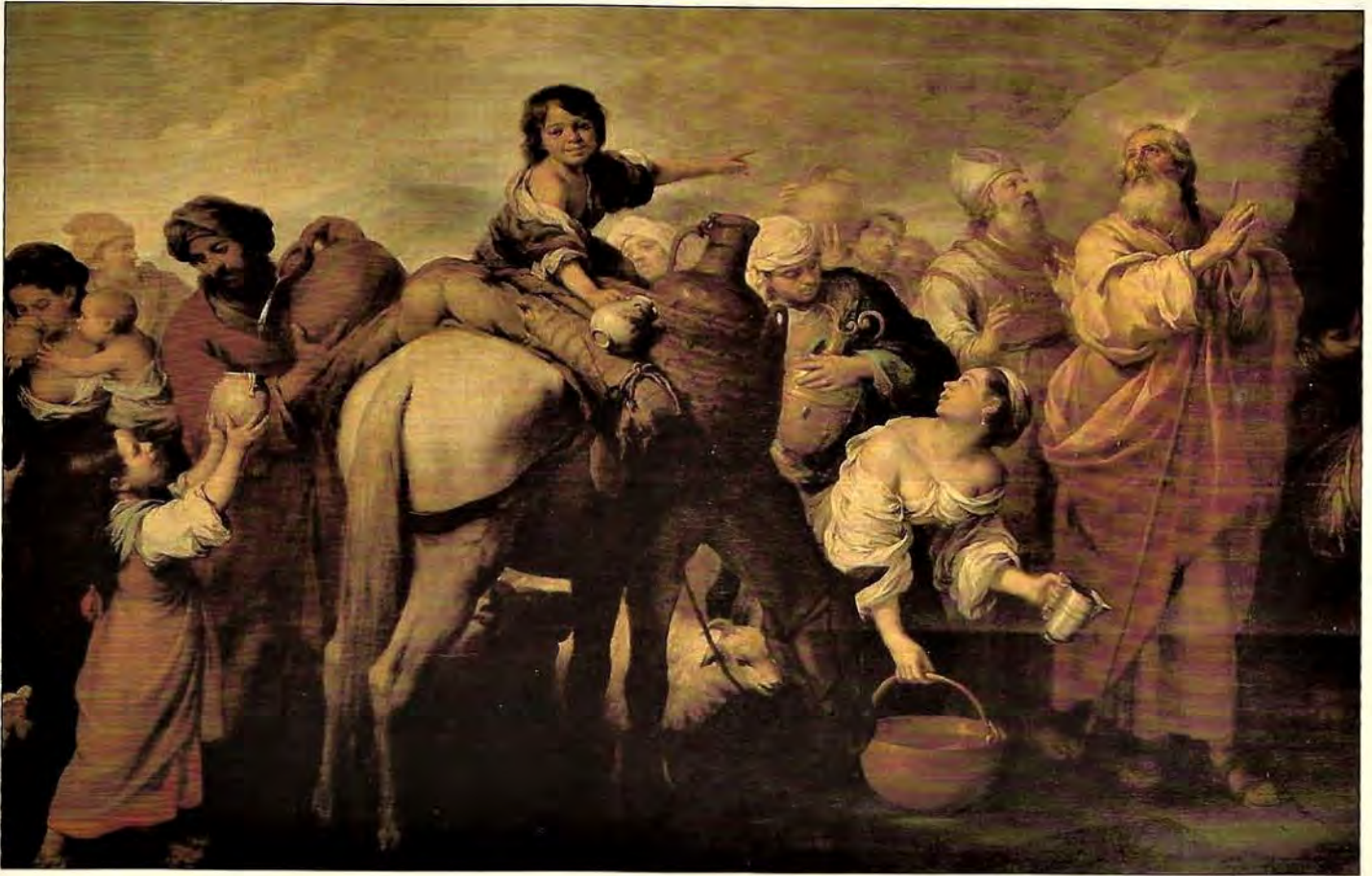
Hospital de la Caridad, Sevilla

par le coup d'État du 2 décembre 1851 (1852), puede acusársele de error en su valoración política, pero no de abandono de los intereses de las clases trabajadoras; no en vano es uno de los pocos intelectuales que procedían de su seno.